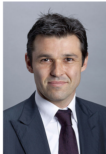
Matthias Aebischer, Nationalrat SP, Bern.