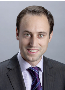
Christian Wasserfallen, Nationalrat FDP, Bern.