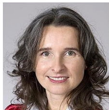
MUDr. Yvette Estermann, Nationalrätin SVP, Luzern.