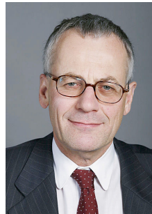
Kurt Fluri, Nationalrat FDP, Solothurn.