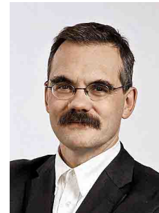
Jean-François Steiert, Nationalrat SP, Vizepräsident des Dachverbandes schweizerischer Patientenstellen, Freiburg.